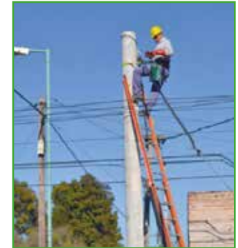
En la Localidad de Pueblo Nuevo, en calle Pasteur e/ Tropero Moreira y el Campo

Retiro de la línea de 4 cables (convencionales), reemplazándola por 200 metros de cable preensamblado de 50 mm 2 , mejorando sustancialmente la calidad del servicio proporcionado.