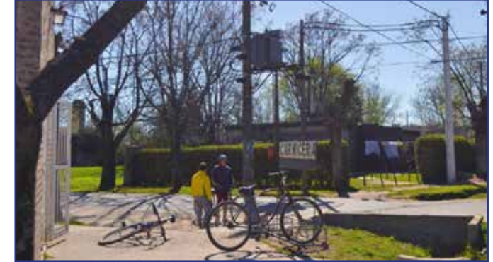
En la localidad de Luján, Bo. San Pedro, Calle el Irupé e/ las Margaritas hasta Palo Borracho y sobre Palo borracho desde Irupé a las Azaleas

Ampliación de Potencia de 160 KVA a 315 KVA, más refuerzo de Línea en Media Tensión, Tendido de 500 metros de cable preensamblado de 120 mm 2 y parte de 50mm 2 . Reporta beneficio directo hacia toda la zona del Barrio San Pedro.